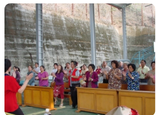
4. 配合宗教慶典舉辦