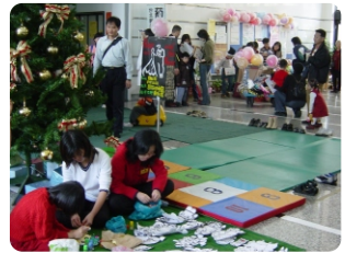
1. 與社區園遊會結合

居住在危險區域的民眾，或者是災害弱勢民眾往往是最容易受到災害衝擊的人，因此可以派員前往其所居住的地方進行個別的溝通，說明可能面臨的災害風險與建議的因應對策等，以提高他們的危機意識。