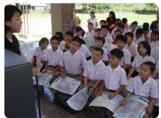
3. 融入學校教學課程