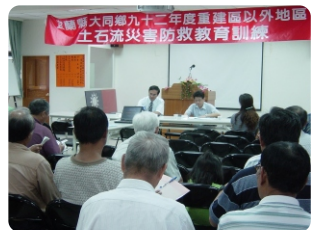
2. 排入里民大會的議程